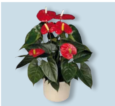
La pianta da vaso Anthurium Turenza®

Turenza® è una varietà di prima categoria soprattutto in vaso 14 cm e 17 cm, ma, rispetto a una varietà come Dakota®, richiede altri metodi di coltivazione. Con la varietà Turenza®, è necessario che la pianta raggiunga una lunghezza sufficiente. Nel caso in cui il trapianto venga effettuato precocemente, questa varietà potrebbe produrre un numero eccessivo di germogli e, inoltre, non raggiungere la lunghezza desiderata. È noto, al contrario, come la varietà Dakota®, per sviluppare una struttura ottimale, necessita di un trapianto tempestivo. Se si desidera una medesima lunghezza delle due varietà in un vaso di 7 cm, la prima fase di coltivazione di Turenza® dovrebbe avere una durata superiore da 6 a 8 settimane rispetto a Dakota®. Va inoltre aggiunto che la pianta, nella fase finale, può essere posizionata a distanza più ravvicinata, con una proporzione di 11-12 piante per m 2 . Per quanto riguarda il periodo di coltivazione di una pianta di 60-65 cm, Turenza® raggiunge le 42-46 settimane, mentre, rispetto ad altre varietà, lo spazio necessario per la sua coltivazione, è di molto inferiore. Inoltre è possibile coltivare un maggior numero di piante per m 2 grazie ad una prima fase di lunga durata e ad una fase finale a distanza ravvicinata.