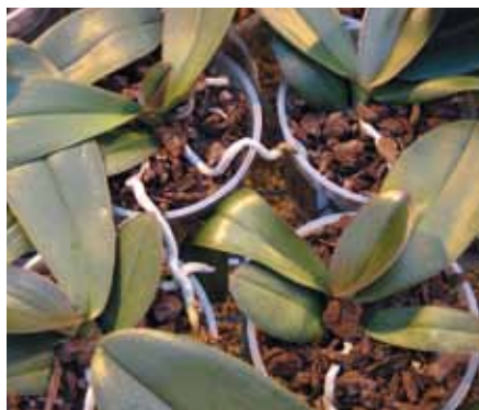
Produzione eccessiva di radici nella varietà Phalaenopsis

1. Il ciclo intermedio ha lo scopo di umidificare la superficie del substrato, favorendo il microclima e la crescita di superficie. Inoltre, ostacola in gran parte una produzione eccessiva di radici e di solito viene effettuato esattamente tra due cicli di o al massimo due giorni prima delle somministrazioni d'acqua. Normalmente viene effettuato un ciclo intermedio a settimana e, in ogni caso, non si dovrebbero mai superare le due volte alla settimana. Infine, questo tipo di irrigazione non deve mai contenere sostanze nutritive per prevenire l'eccessiva presenza di sali minerali in superficie al substrato.