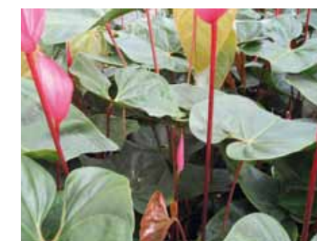
Il metodo mezza foglia ottimizza la fotosintesi della coltura

Quando l'energia luminosa (fotoni) viene assorbita dalla foglia attraverso i cloroplasti può essere