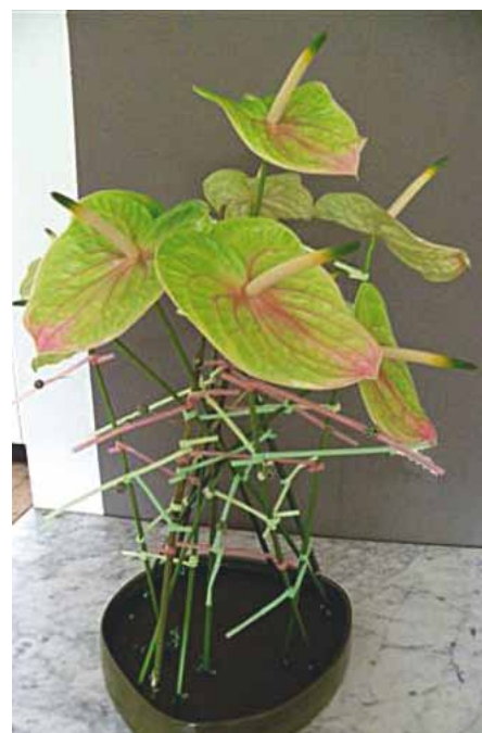
Lucardi® in un bouquet/composizione

Questo fiore, dai freschi colori estivi, si presta benissimo ad essere combinato con altri fiori nella composizione di bouquet. I bordi presentano un colore verde pastello che sfuma nel giallo-limone/verde, il colore predominante del fiore, con striature rosso/rosa che sono presenti tutto l'anno. Se si preferisce una più delicata colorazione autunnale, è possibile ritardare la raccolta di Lucardi® di quattro settimane e ottenere così un prezioso colore antichizzato. Grazie alle diverse sfumature cromatiche, sarà sempre possibile combinare il fiore nelle composizioni desiderate.