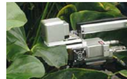
Misurazione della fotosintesi nell'Anthurium

circostante sotto forma di calore. Dalla reazione chimica sopra riportata si spiega come la velocità della fotosintesi e la quantità di zuccheri prodotti dipendono da: luce e dispersione di luce, CO 2 e temperatura. Questi quattro fattori verranno qui di seguito trattati separatamente. L'articolo si conclude, infine, analizzando come la pianta utilizzi gli zuccheri prodotti.