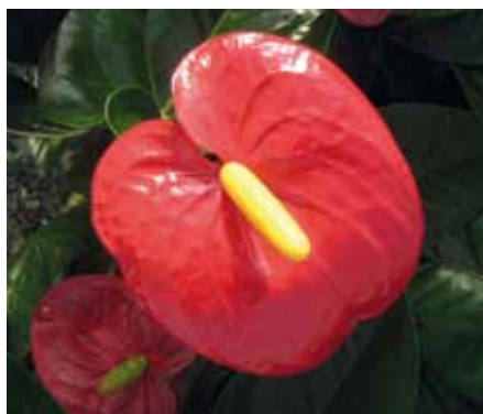
Un primo piano di un bellissimo fiore di Turenza®

La sua adattabilità ai vasi 14 cm, 17 cm e 21 cm fa sì che Turenza® possa essere proposta su qualsiasi mercato. Nessun altro Anthurium rosso da vaso è inoltre dotato di fiori così grandi e brillanti, caratteristica che rende Turenza® unica. Le foglie belle, robuste e brillanti completano il quadro. I fiori sovrastano le foglie, risaltando per il loro colore acceso e la loro posizione. La struttura della pianta, unita al colore e alle dimensioni del suo fiore, conferisce alla varietà un aspetto sensuale e insieme maestoso ed elegante. La resistenza al